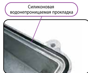
Серия HQ0XXS Водонепроницаемый вариант IP67 Цельная по периметру силиконовая водонепроницаемая прокладка