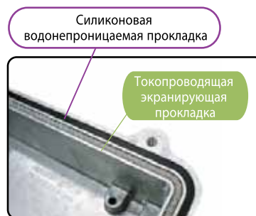
Серия HQ0XXEMS Водонепроницаемый вариант IP67 С дополнительной цельной по периметру токопроводящей экранирующей прокладкой