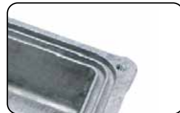
Серия HQ0XX Простой вариант без элементов уплотнения

Кроме экранированных корпусов специального назначения серии HQ0xxEMS, для заказа доступны экранированные корпуса широкого применения серии G0XXX, предназначенные для бытовых, радиочастотных, сетевых и электротехнических приложений.