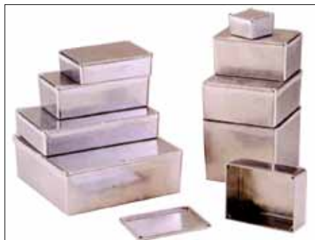
Корпуса серии G0XXX

Политика компании GAINTA основана на том, что кроме лидерства в технической сфере, она нацелена на стремление к максимальному пониманию потребностей своих заказчиков. Компания разрабатывает продукты в тесном сотрудничестве с клиентами, используя при этом информацию от глобальной клиентской базы, что дает возможность компании GAINTA создания корпусов для новых приложений и улучшать серийно выпускаемые продукты.